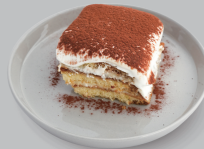
ティラミス TIRAMISU 580