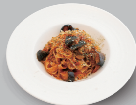
アラビアータ ARRABBIATA 980