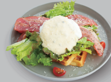
ベーコンエッグワッフル BACON EGG WAFFLE

HONEY SYRUP / CHOCOLATE SYRUP / CARAMEL SYRUP