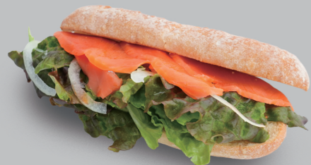
サーモンレタスサンド SALMON LETTUCE SANDWICH 780