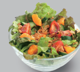
サラダ SALAD 単品 200