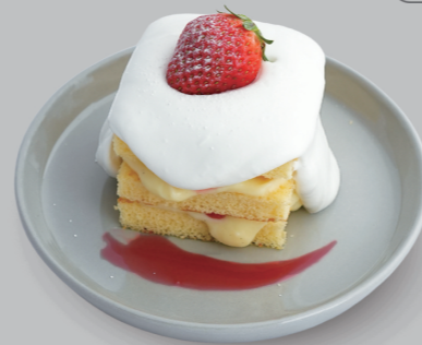
苺のケーキ STRAWBERRY CAKE 580