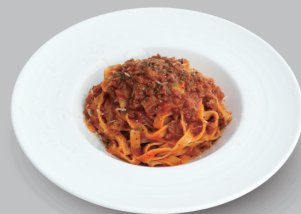
ボロネーゼ BOLONESE 980