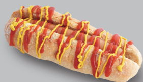
ホットドッグ HOT DOG 580