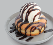
チョコレートアイスドーナツ CHOCOLATE ICE CREAM DONUTS 600