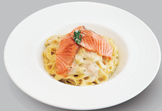
炙りサーモンのクリームパスタ GRILLED SALMON CREAM PASTA 1,280