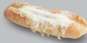
チーズドッグ CHEESE DOG 680