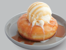
キャラメルアイスドーナツ CARAMEL ICE CREAM DONUTS 600

ESPRESSO SYRUP / 舞鶴産茶葉 MATCHA SYRUP / 舞鶴産茶葉 HOJICHA SYRUP