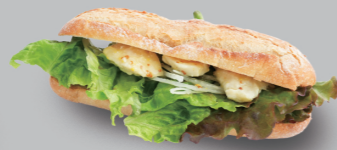
ハニーチキンサンド HONEY CHICKEN SANDWICH 710