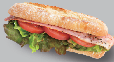
BLTサンド BACON LETTUCE AND TOMATO SANDWICH 700