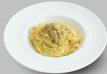
カルボナーラ CARBONARA 980